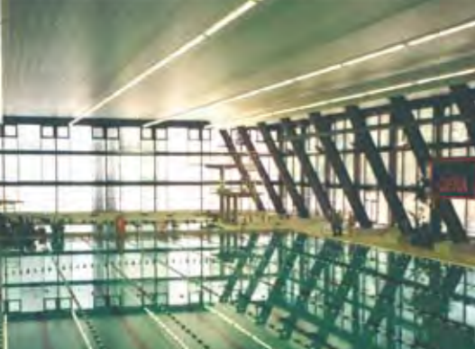
Бассейн „Хофизенбад“ в Гере