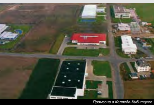
Промзона в Келледе-Киблицхе