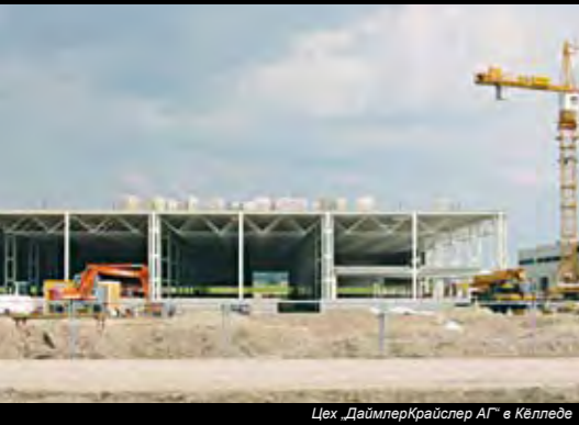
Цех „ДаймлерКрайслер АГ“ в Келледе