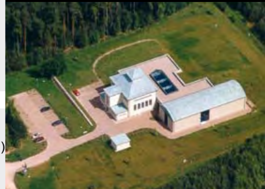
Установка для очистки воды в Бао-Берка