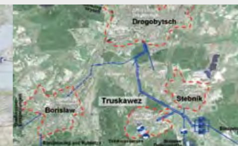
Система водоснабжения на Западной Украине