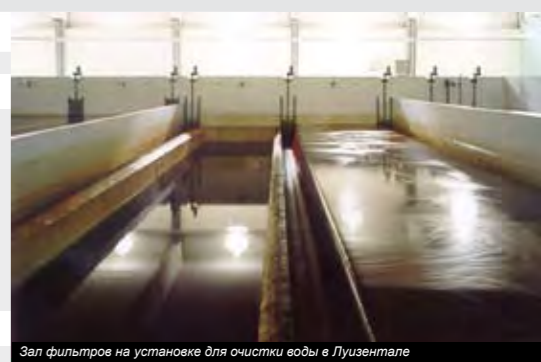
Зал фильтров на установке для очистки воды в Луизентале