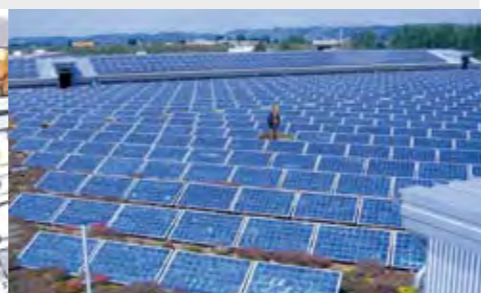
Гелиоэлектростанция лиенсуска в Дрездене