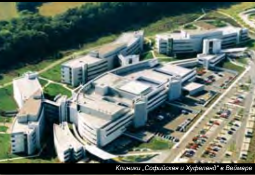
Клиники „Софийская и Хуфеланд“ в Веймаре