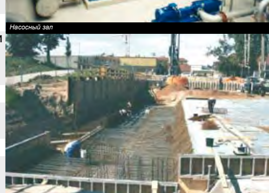
Ливнепуск в Дрездене