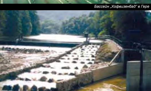
ГЭС и лестница-рыбоход в Крумбахе