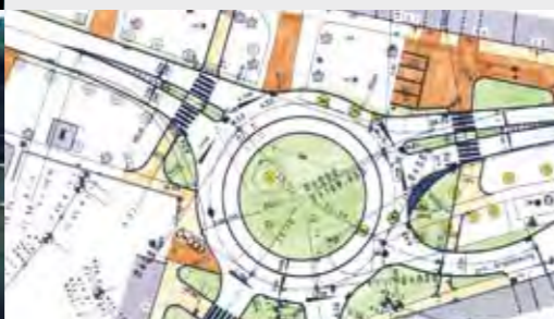
Круговое движение в Келледе